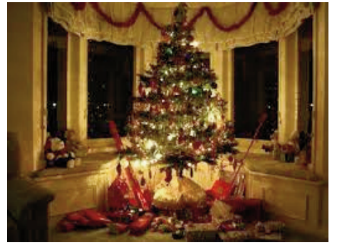
bayramı yalnız evlərində qeyd edə biləcəklər.

Somali hökuməti də Yeni il keçirməyi Xristian adəti olması ilə əlaqədar qadağan edib. Somalidəki xristianlar bu