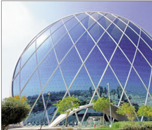
Birləşmiş Ərəb Əmirliklərinin paytaxtı