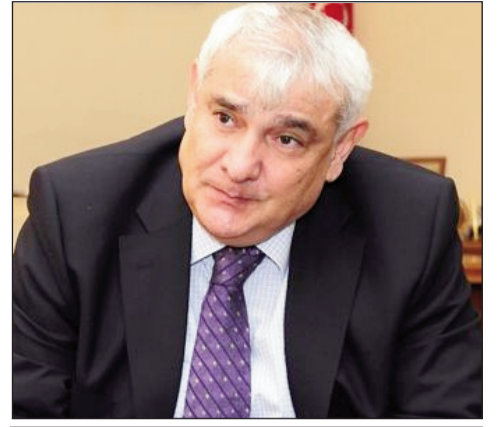
KAMAL ABDULLAYEV, Azərbaycan Respublikasının millətlərə-rası, multikulturalizm və dini məsələlər üzrə Dövlət müşaviri, akademik

Xidmət bu il ərzində də ölkədə milli azlıqların hüquq və azadlıqlarının müdafiəsi, onların mədəni-mənəvi irsinin qorunması və dini etiqad azadlığının təminatı ilə bağlı yerli icra hakimiyyəti orqanları və