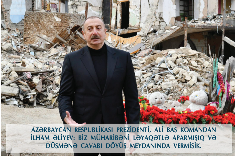
AZƏRBAYCAN RESPUBLİKASI PREZİDENTİ, ALI BAŞ KOMANDAN İLHAM ƏLİYEV: BİZ MÜHARİBƏNİ LƏYAQƏTLƏ APARMIŞIQ VƏ DÜŞMƏNƏ CAVABI DÖYÜŞ MEYDANINDA VERMİŞİK.

Ermənilərin Ağdam və Füzulini bombalaması. Ermənilər İkinci Qarabağ müharibəsi dövründə Ağdam və Füzulinin ötən əsrin 90-cı illərində işğal edə bilmədikləri kəndlərini də bombalamaqla ciddi dağıntılara və mülki insanların zərər çəkməsinə səbəb oldular. Sual olunur: kim üzr istəməlidir?